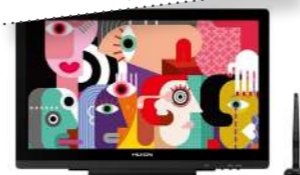
Tablette graphique avec écran