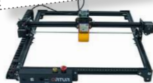
Graveur Laser numérique