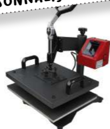
Presse à chaud