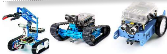
Kits Robots (robotique et programmation)