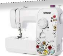
Machine à coudre